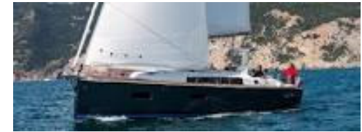
Das Küstensegeln ein beliebter Freizeitsport

"Ihr persönlicher Skipper verfügt über die Erfahrung vieler Seemeilen auf fast allen Weltmeeren und hat immer eine Lösung für die vielfältigen Aufgaben sowohl in Theorie und Praxis. Gemeinsam schaffen wir das. Sprechen Sie uns an. "